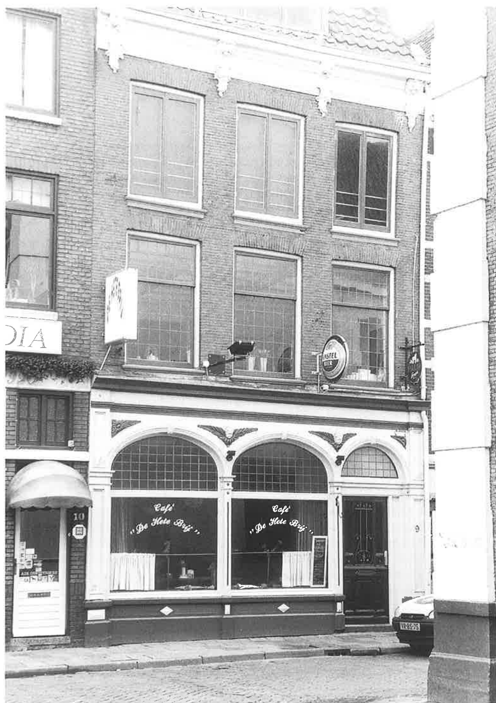
Nieuwe Markt 9