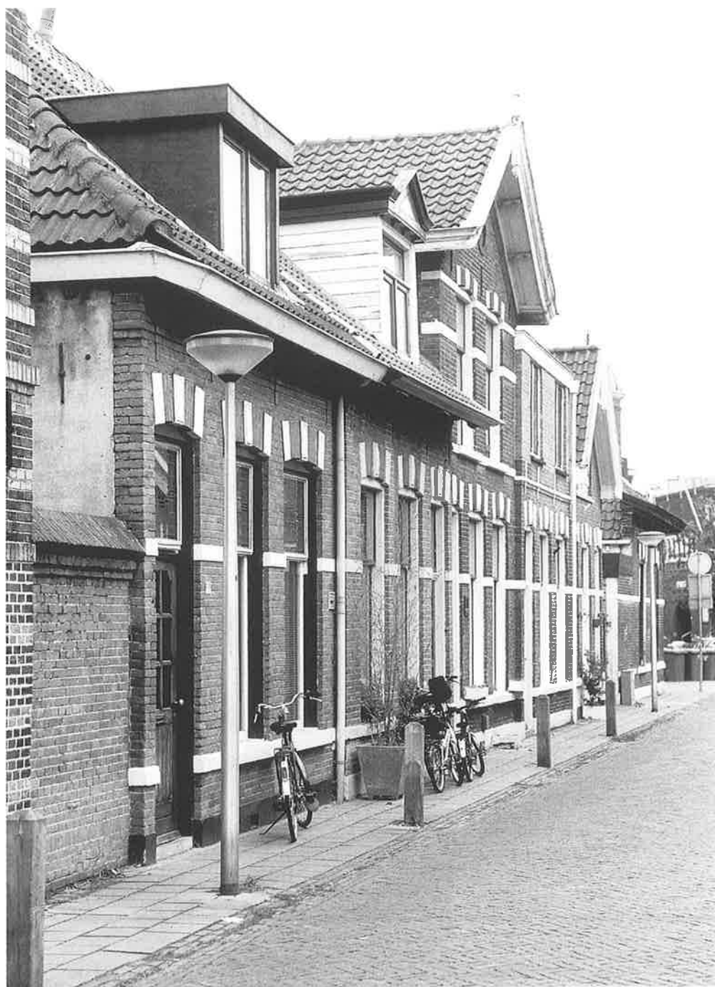
Tuindwarsstraat, thans Venestraat. Cohen woonde waarschijnlijk in het huis met het puntdak