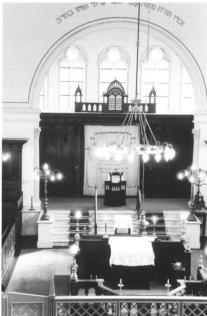
Interieur van de synagoge in 1999