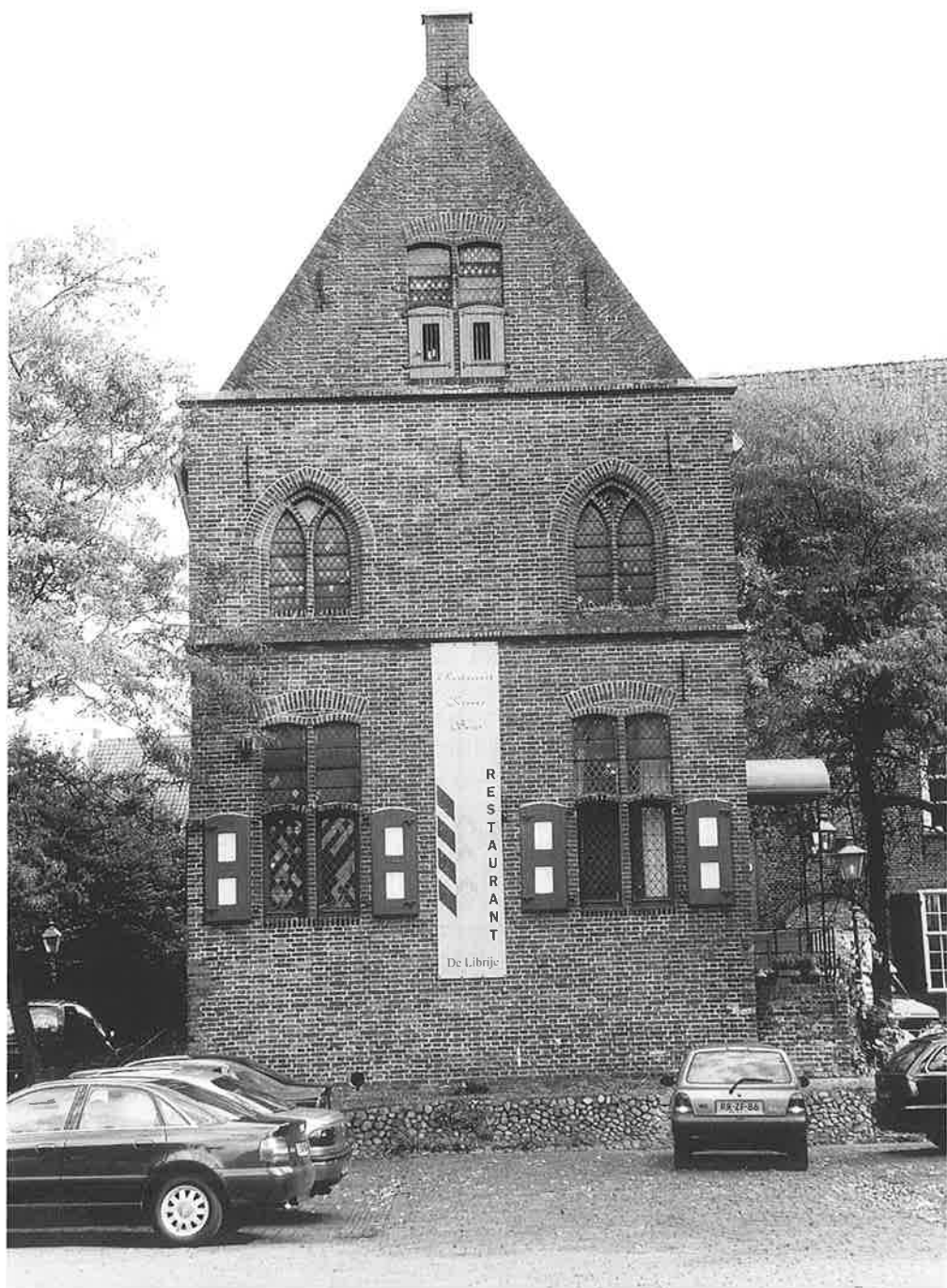
De Librije in 1999