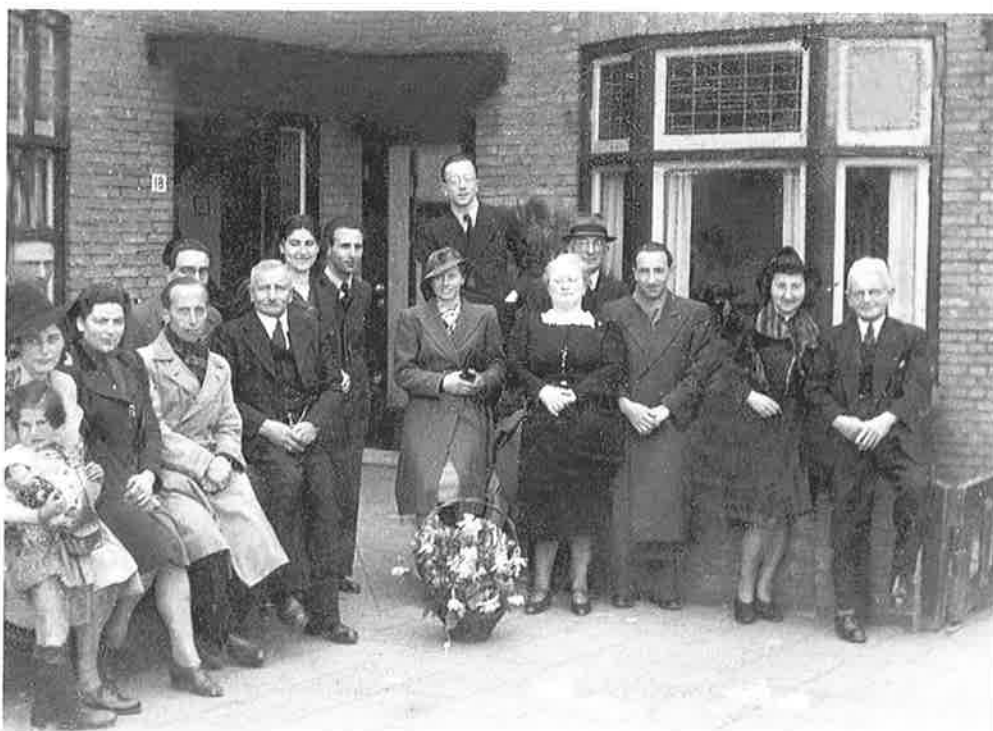
Reünie van de onderduikers