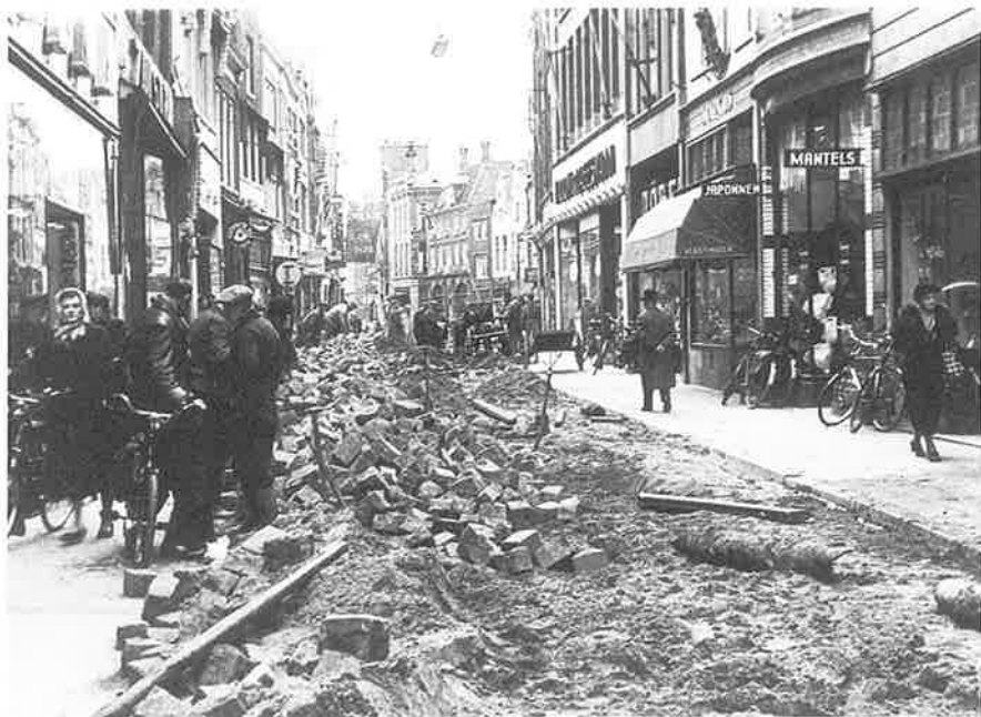
De Diezerstraat ca. 1960. Rechts de firma Marcus