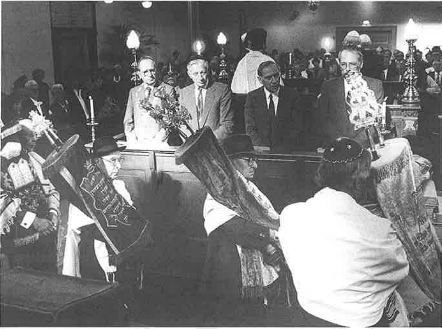
Herinwijding synagoge 20 september 1989 (Nederlands Israelitische Gemeente Zwolle)

zou de omvang van de joodse gemeenschap in Zwolle verder afnemen door vergrijzing, verhuizing naar de Randstad en vertrek naar Israël. In 1951 telde de gemeenschap nog 150 leden, in 1991 nog maar de helft daarvan.