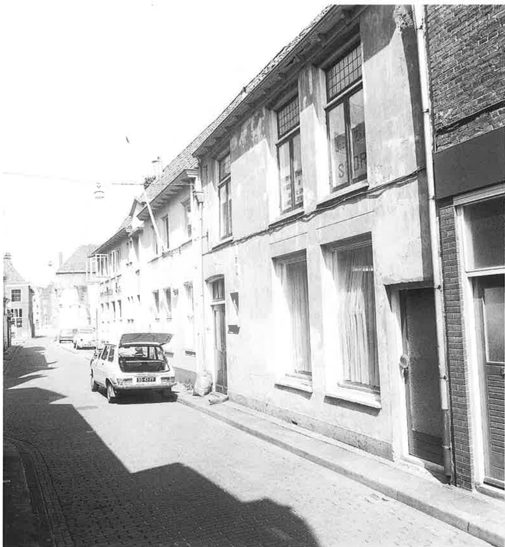
Bitterstraat in de jaren '70 van de 20ste eeuw. Op de plek van het pand waarvoor de geparkeerde auto staat, stond in de 18de eeuw de Oude Munt