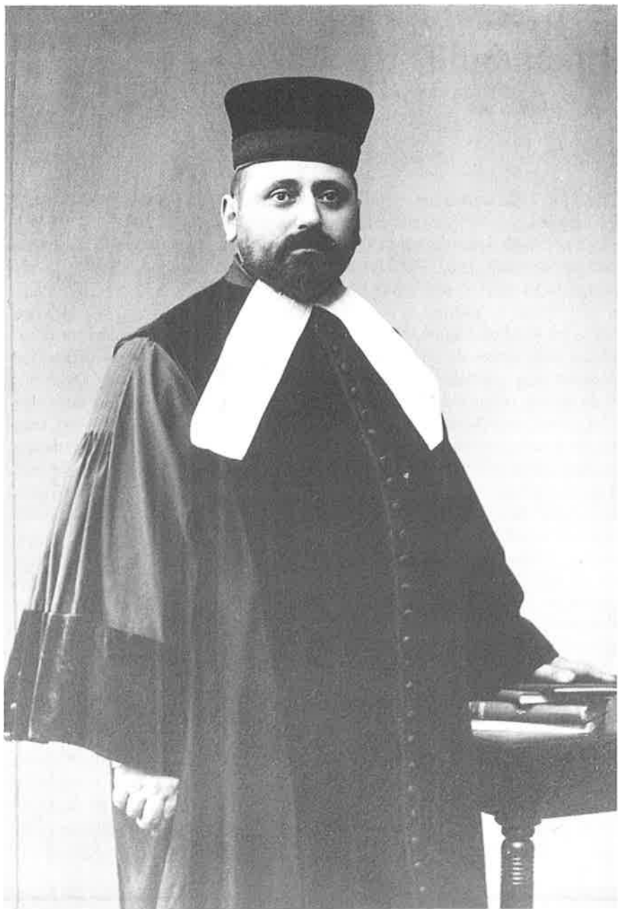
Opperrabbijn S.J. Hirsch