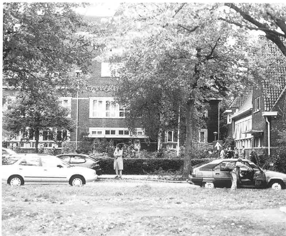
Gymnasium Ceeleum aan de Veerallee