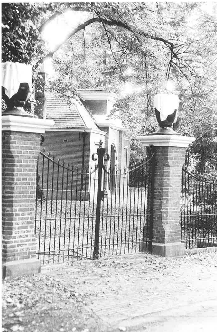
Ingang van de nieuwe begraafplaats met het gerestaureerde metaheirhuisje