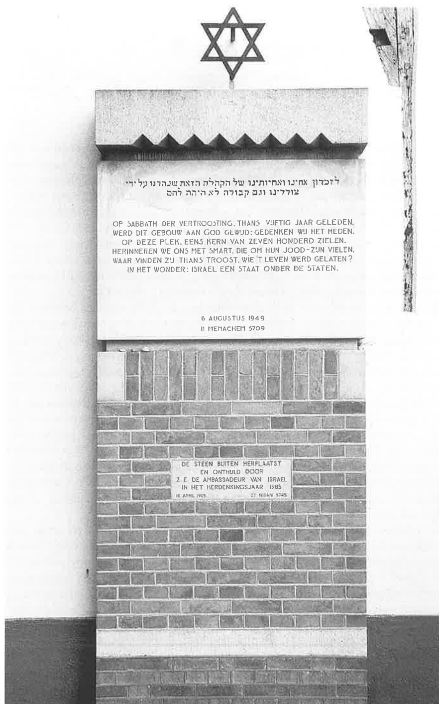
Herdenkingssteen uit 1949 in 1985 herplaatst terzijde van de synagoge