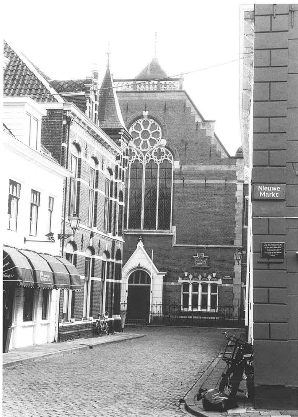
De synagoge aan de Samuel Hirschstraat