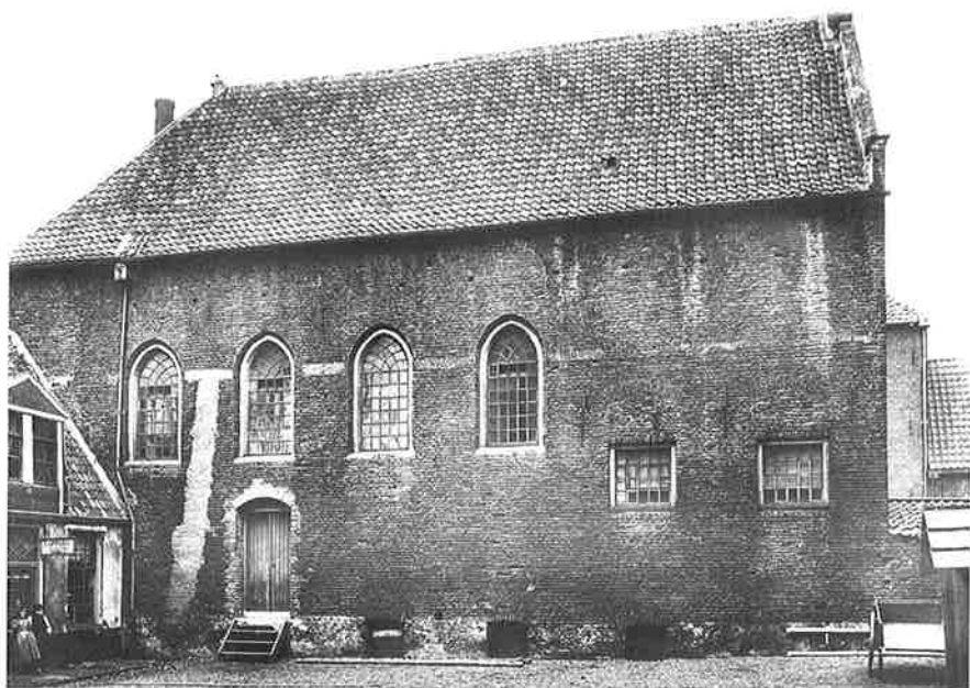
De Librije, van 1758 tot 1899 synagoge