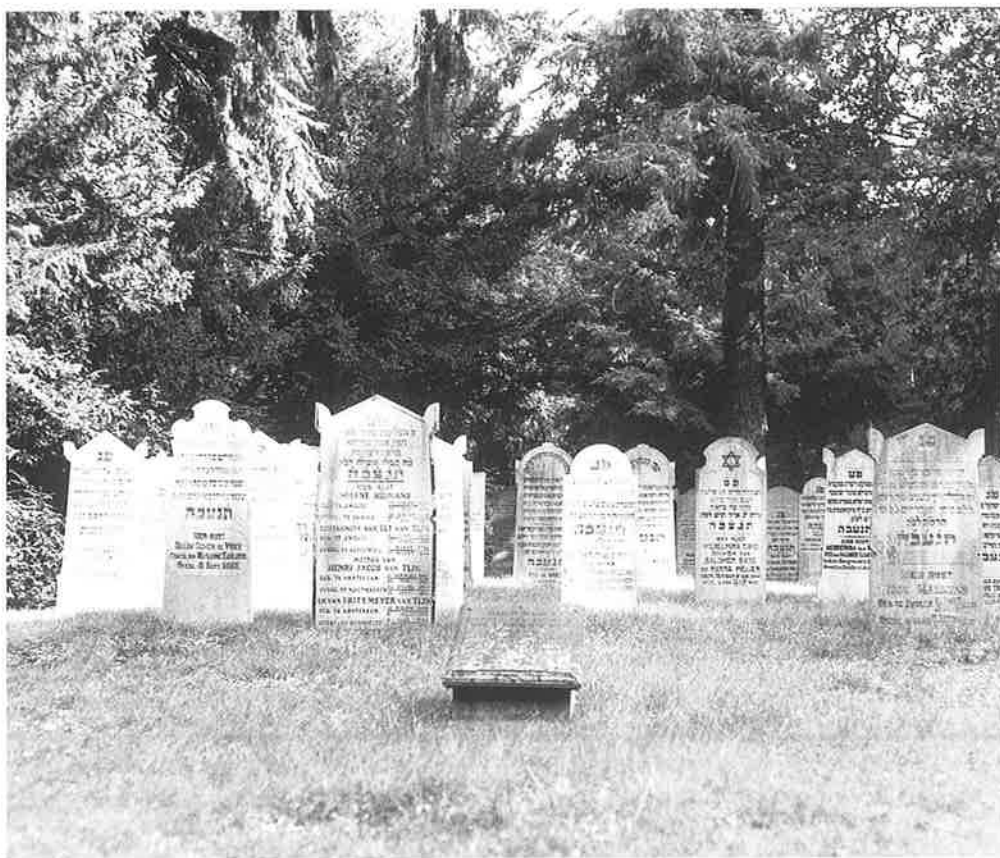
Overzicht van de begraafplaats