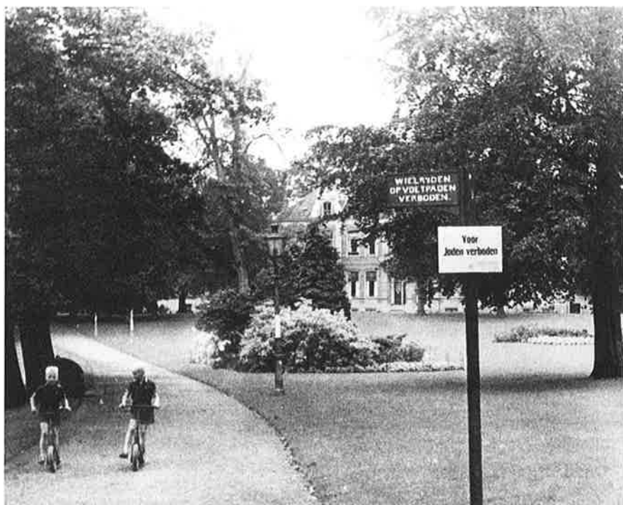
Het Ter Pelkwijkpark: voor joden verboden in bezettingstijd (Reinking)