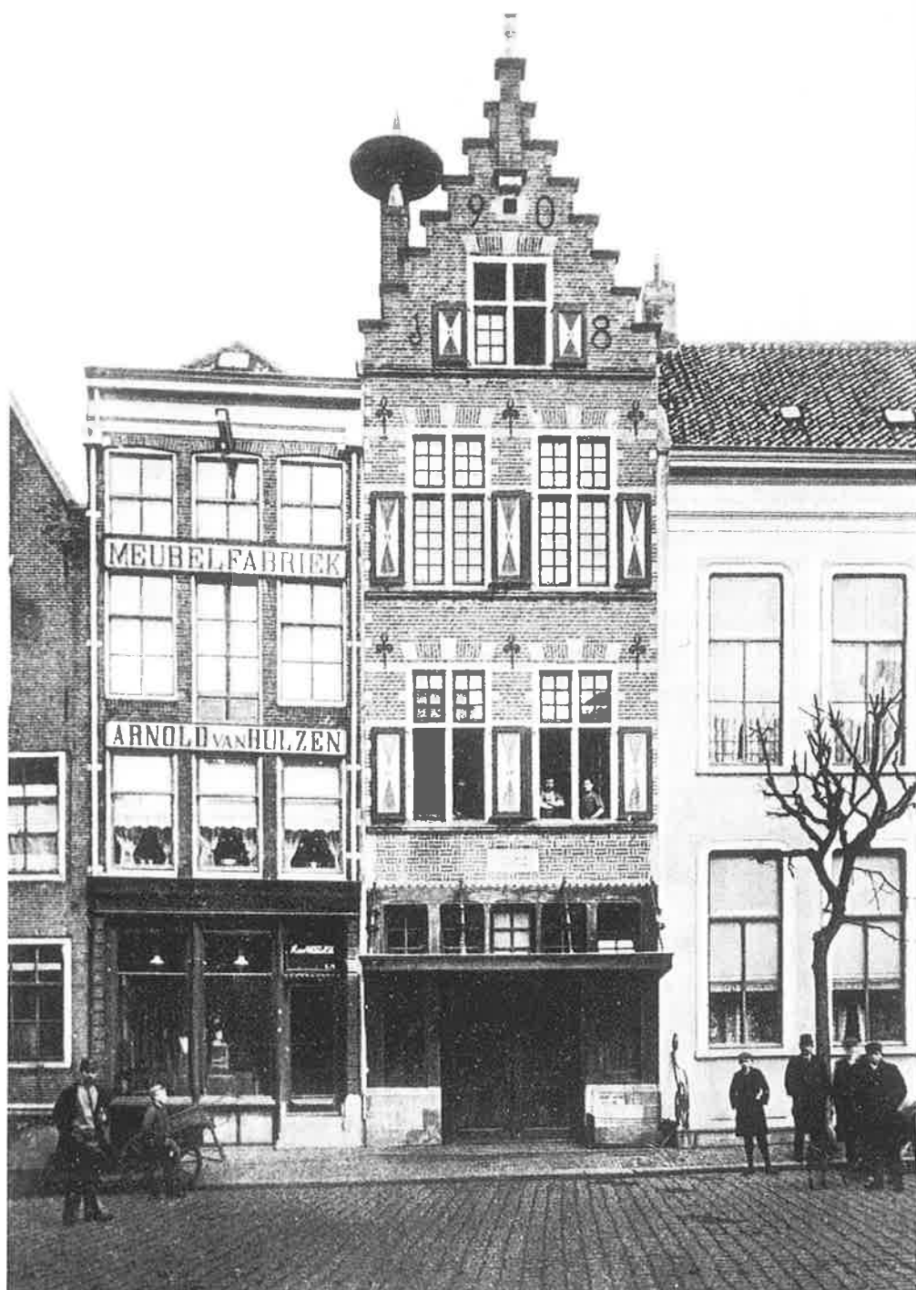
Oude Vismarkt 13 ca. 1925