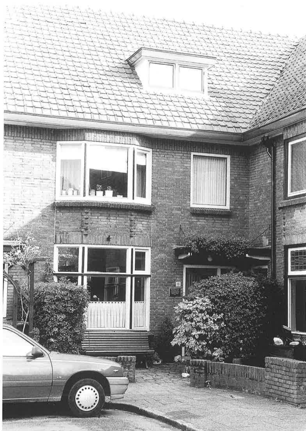
P.C. Hooftstraat 18