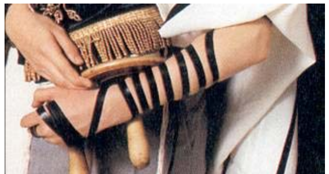
Tefillien: op linkerarm tegen het hart