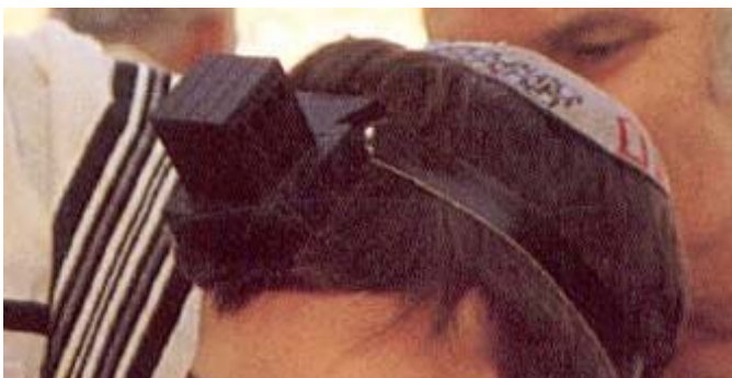
Tefillien: op het voorhoofd

Maar de drie- en vierarmige Sjin worden ook gezien als een verwijzing naar de drie aartsvaders Abraham, Izaäk en Jakob, en naar de vier aartsmoeders Sara, Rebekka, Rachel en Lea.